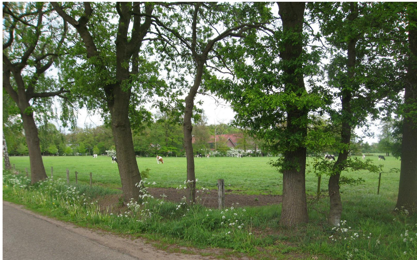
04 bestaande situatie