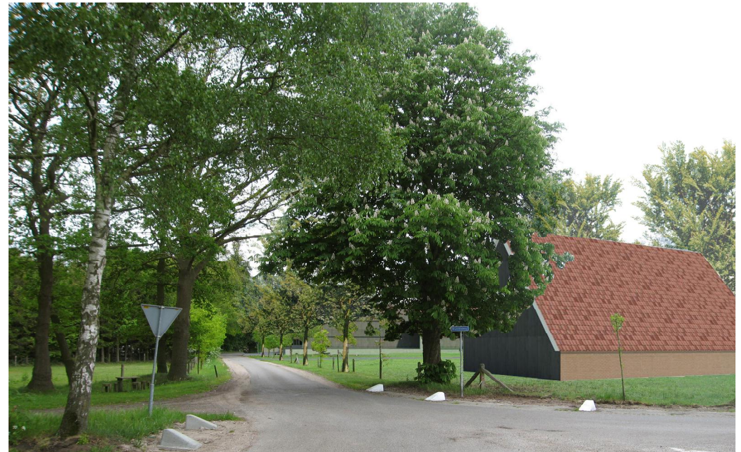
02 situatie vanaf de kruising Bruninksweg/Grote Veldweg