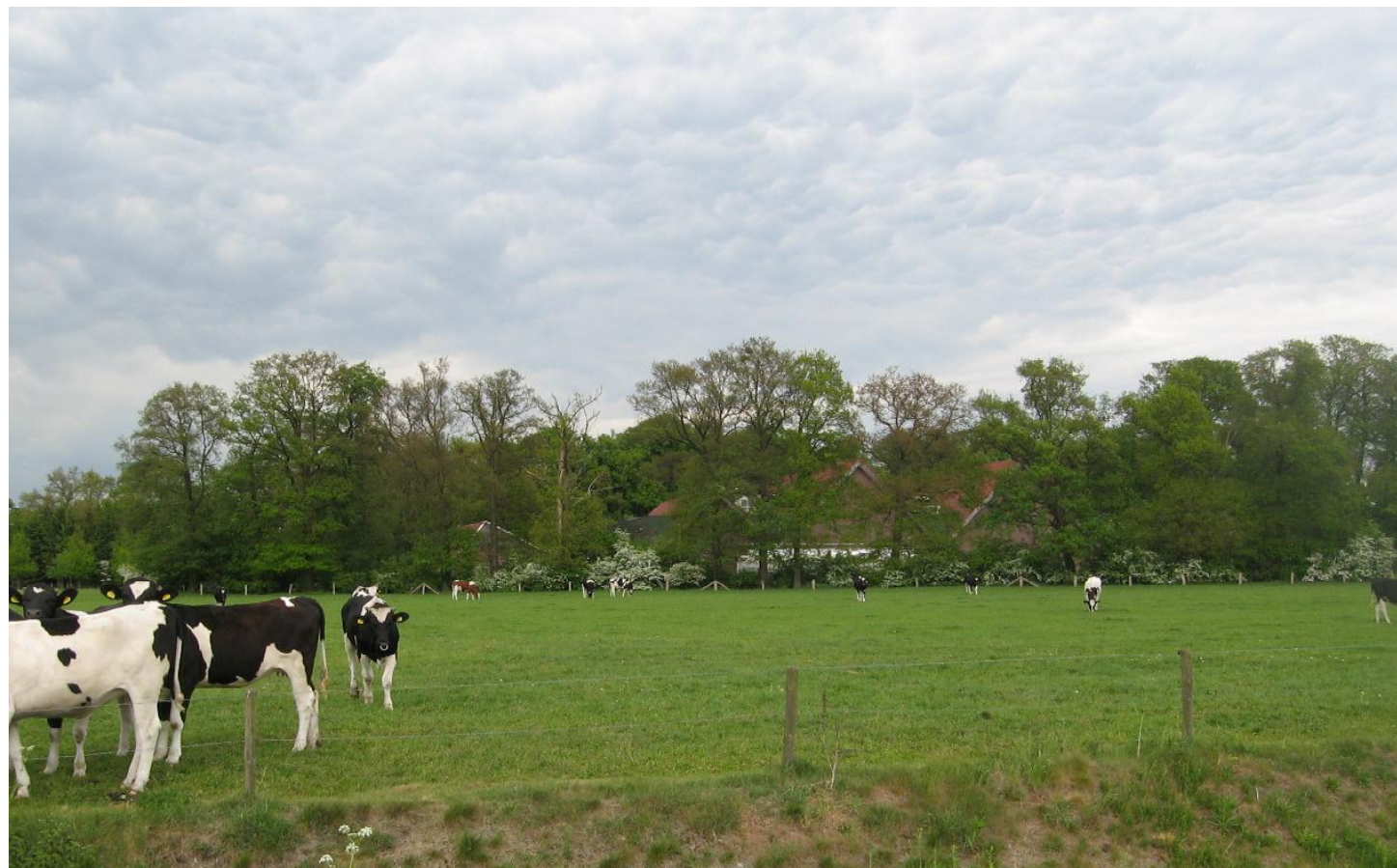
05 bestaande situatie