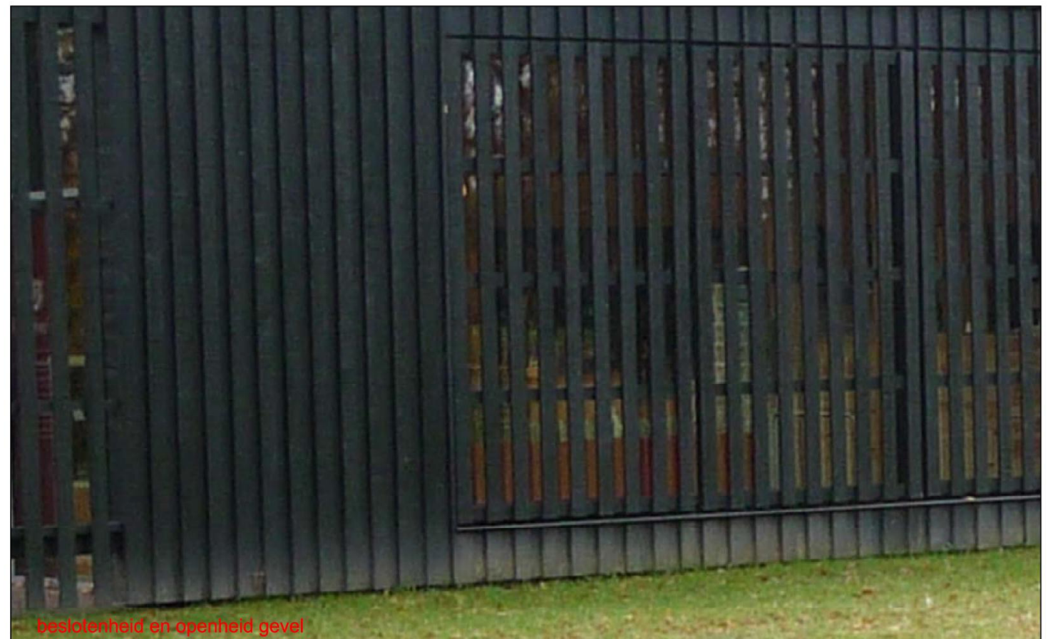
beslotenheid en openheid gevel