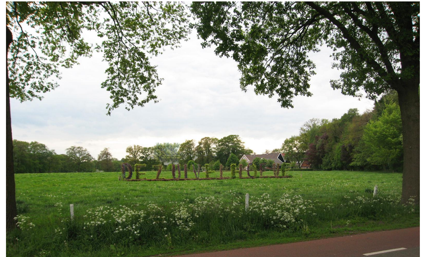
06 situatie vanaf de Tweekelerweg