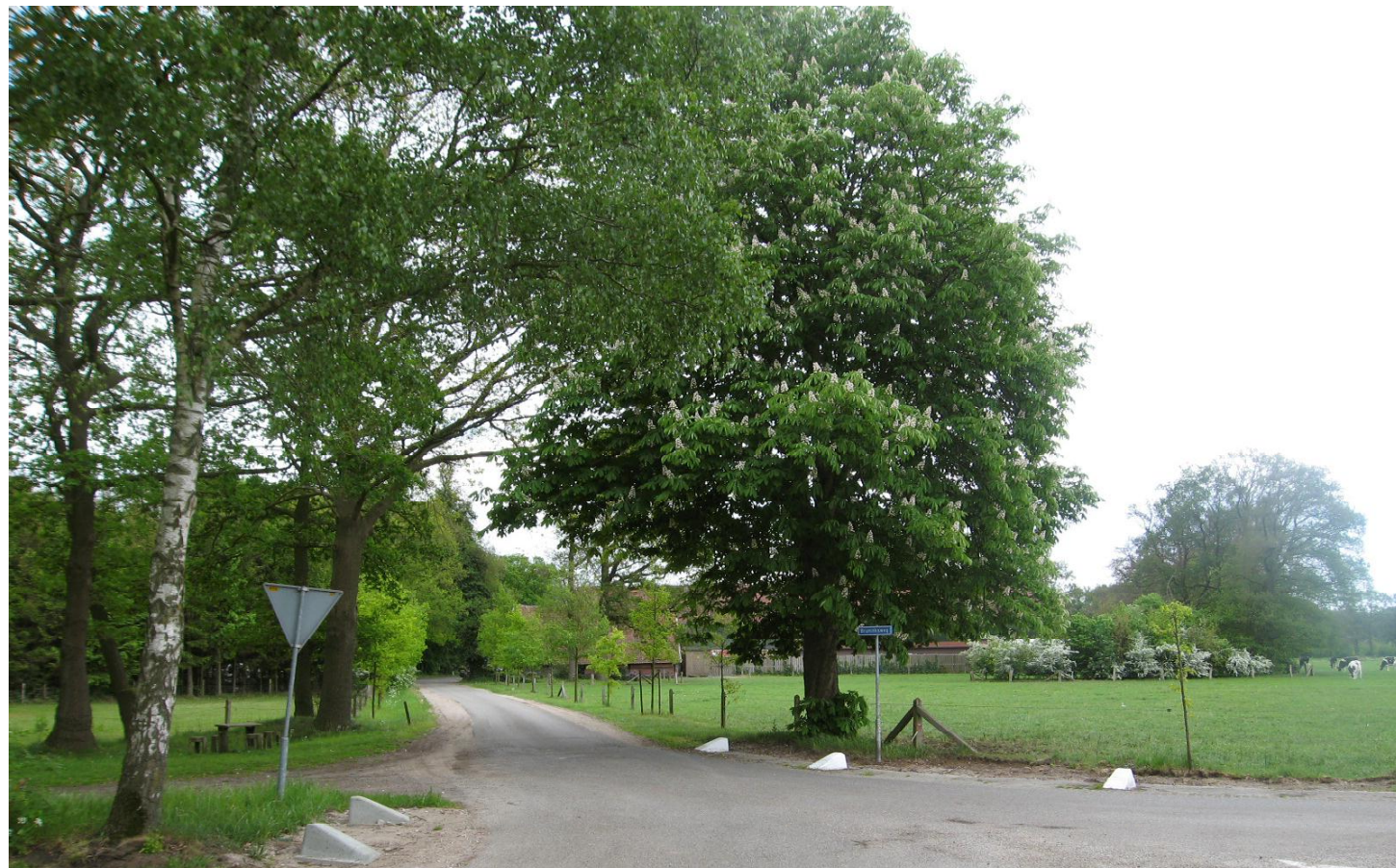
02 bestaande situatie