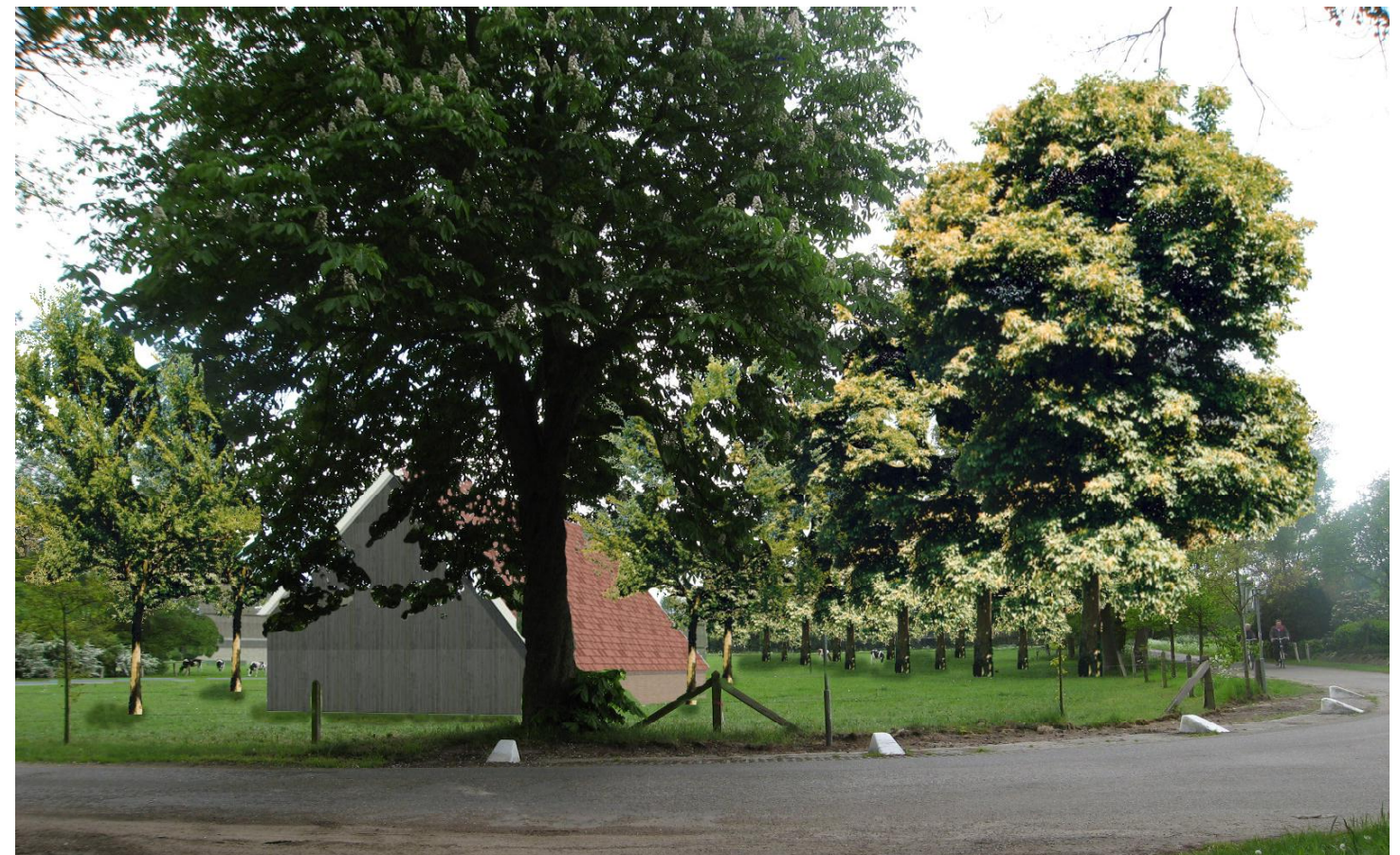
03 situatie vanaf de kruising Bruninksweg/Grote Veldweg