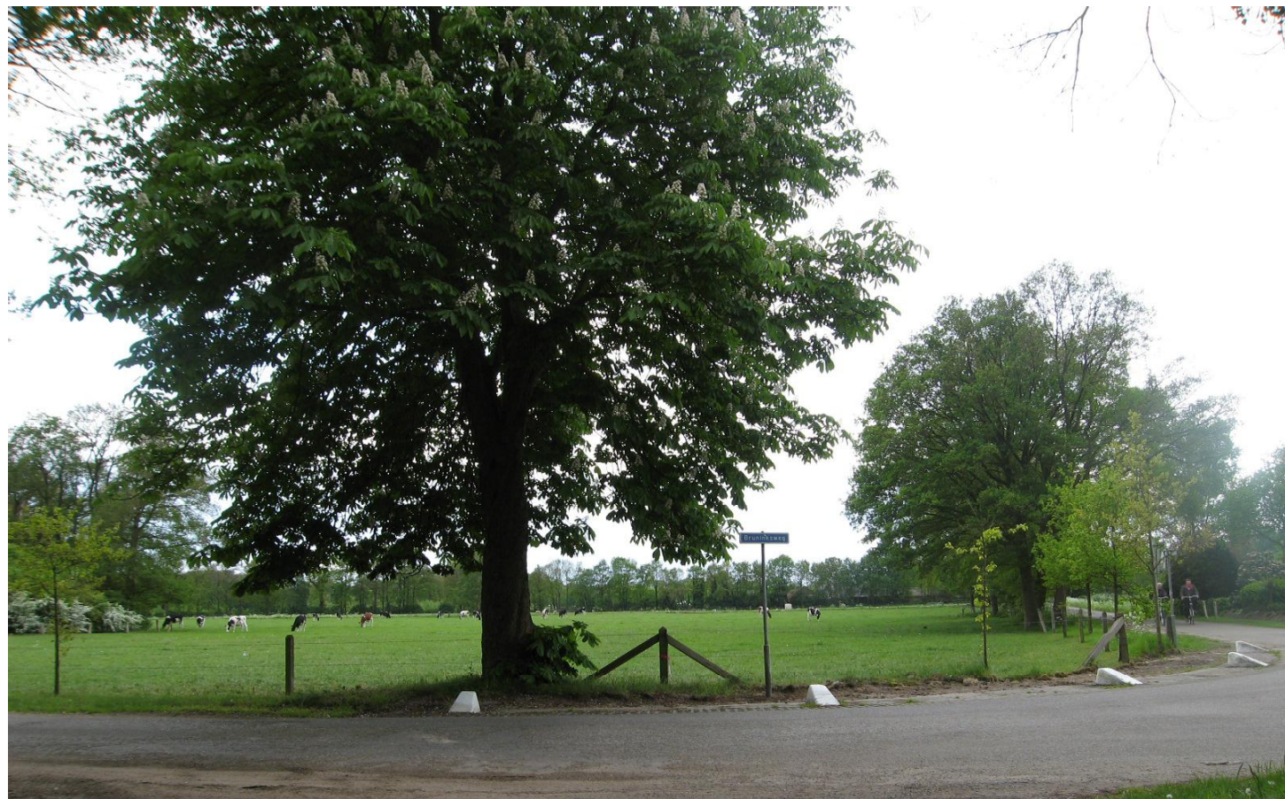
03 bestaande situatie