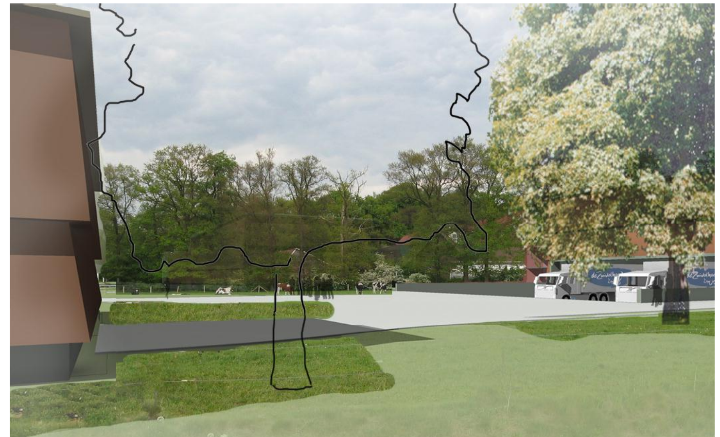
05 situatie vanaf eigen terrein gezien