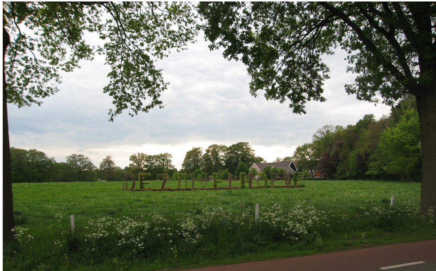
06 bestaande situatie