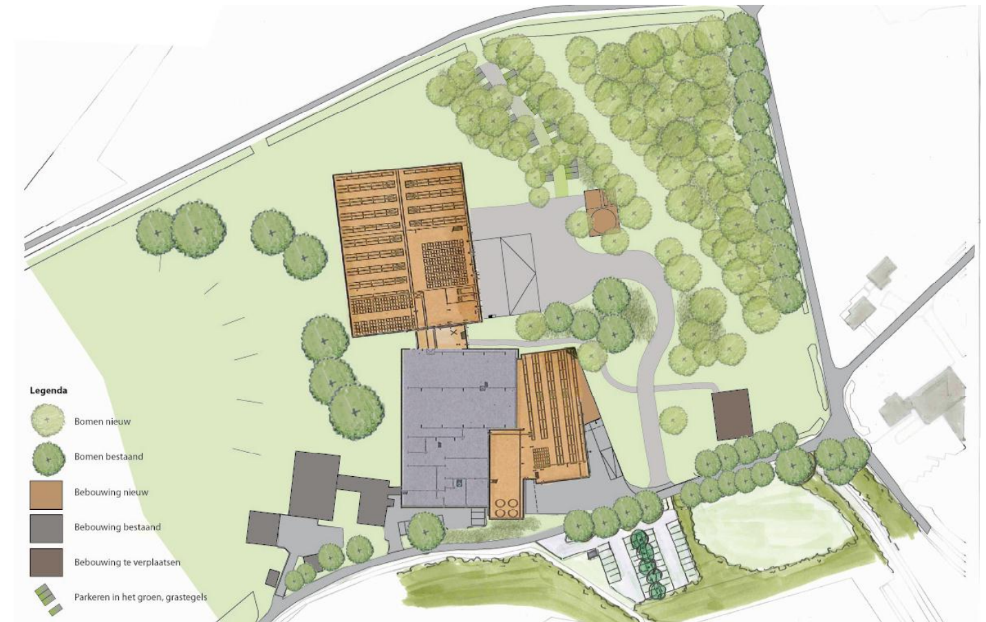
Schets nieuwe situatie