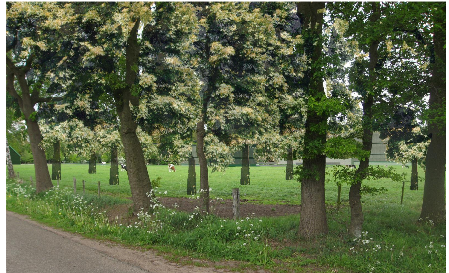
04 situatie vanaf de Grote Veldweg