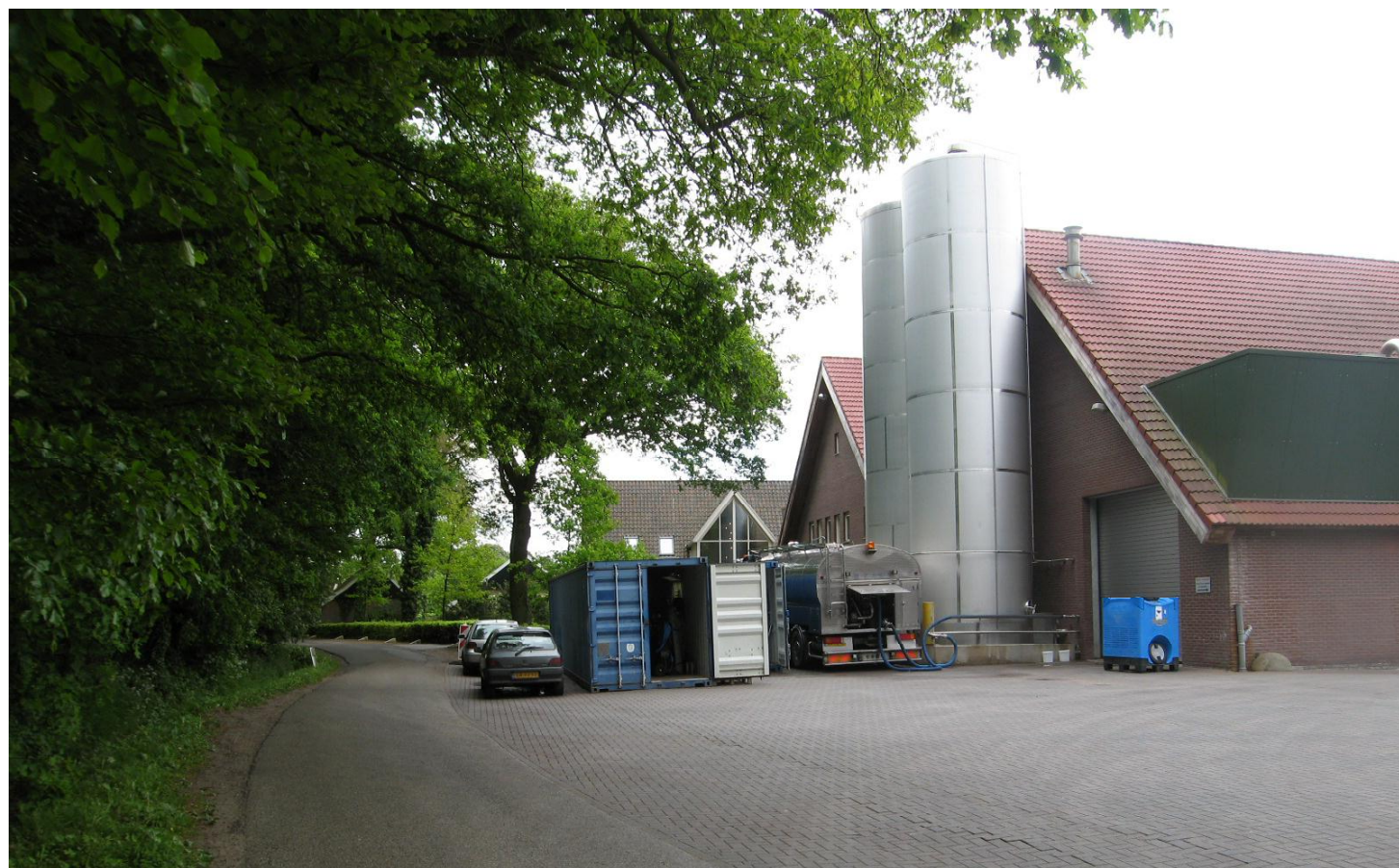
01 bestaande situatie