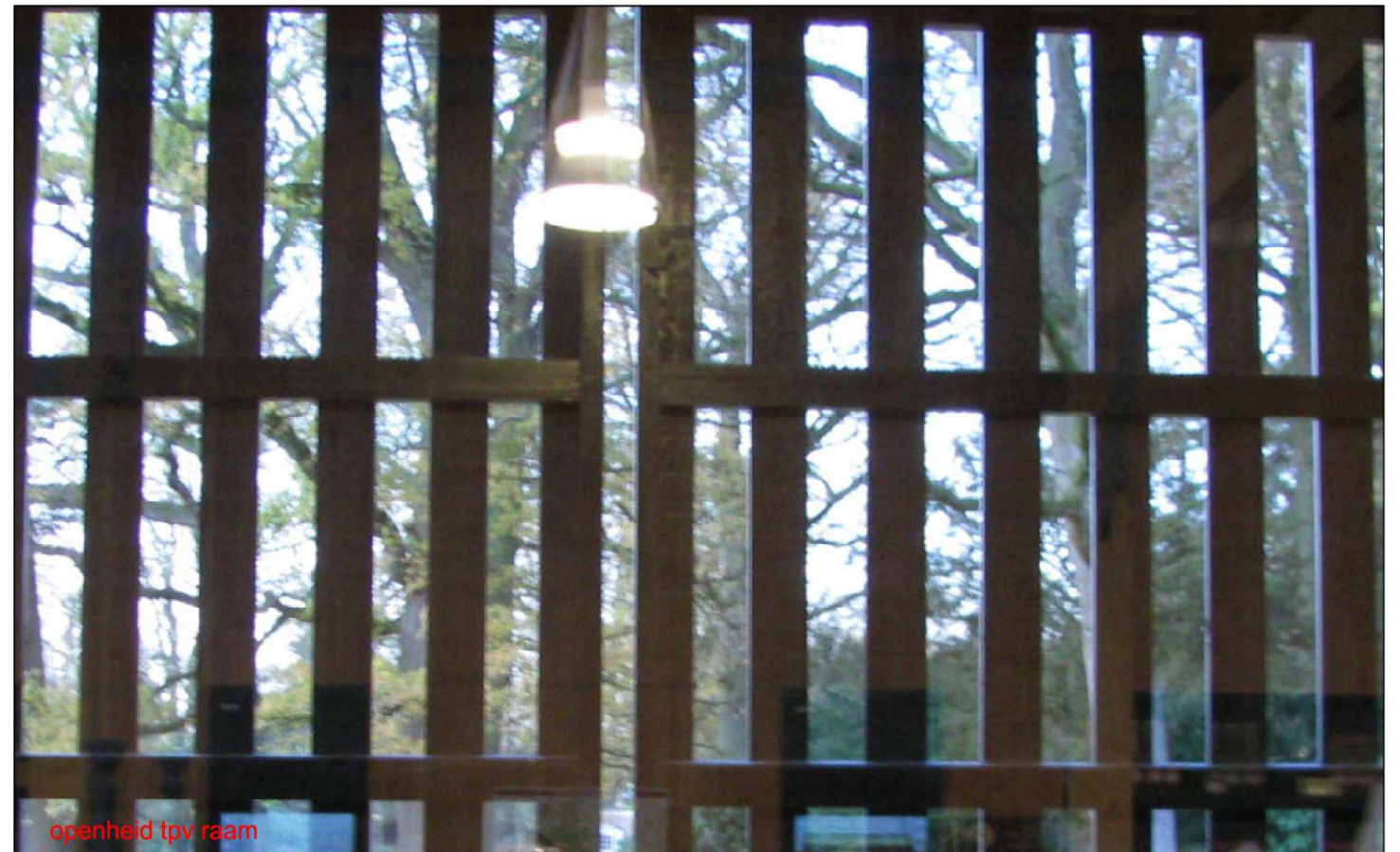
openheid tpv raam